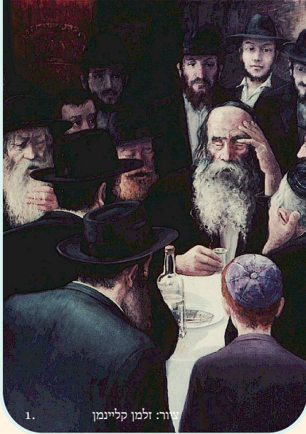
1. ציור: זלמן קליינמן