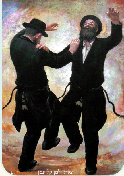
ציור: זלמן קליינמן