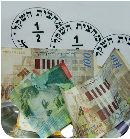
מאת הרב מאיר ערד